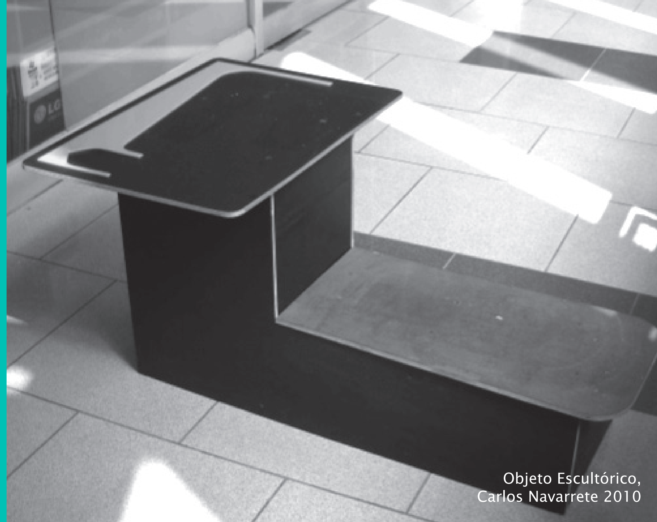
Objeto Escultórico, Carlos Navarrete 2010

Ex Caseta de Guardia Espacio de intervención artística, ubicada en el patio del Instituto de Arte PUCV. Envío de Proyectos a excasetadeguardia@gmail.com Bases en www.arte.ucv.cl Curador Peter Kroeger Clausen