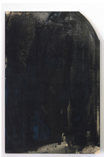
Sans titre , 2012, acrylique, encre, poussière et sciure sur bois, 41 x 60 cm.

Force était de constater, cependant, que les deux supports différaient en contenu et en traitement. D'un côté les images portaient des découpes et des plis variés, cadrées par des marges inégales. De l'autre les dessins étaient plus instinctifs et directs, quelques lignes irrégulières d'un trait sensible. Mais obtenus par quelle règle, quel protocole? L'aléatoire seul ne semblait pas être de mise, tant le placement paraissait juste. En effet, la réduction de la couleur et du trait à l'essentiel dénote un choix quant au placement comme, par exemple, le dessin Sans titre de 2011, avec un seul trait vert vertical, mais dont un bout se détache, suggérant un brin d'accident assumé. Il ne faut pas négliger une autre sorte de trait obtenu par le pliage, trait obtenu sans outil, responsable de l'apport d'une troisième dimension à la feuille, qui n'est autre chose qu'un objet très plat. L'exigence formelle est d'autant plus troublante : on imagine aisément la précision nécessaire pour infliger un pli à une feuille où le trait est déjà décidé, ou vice-versa. Finalement, le choix de différents papiers, ici rugueux, là plus lisses, avec des tons différents, suggérait une importance du matériau.