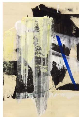
Sans titre , 2012, acrylique et encre sur bois, 33 x 49 cm