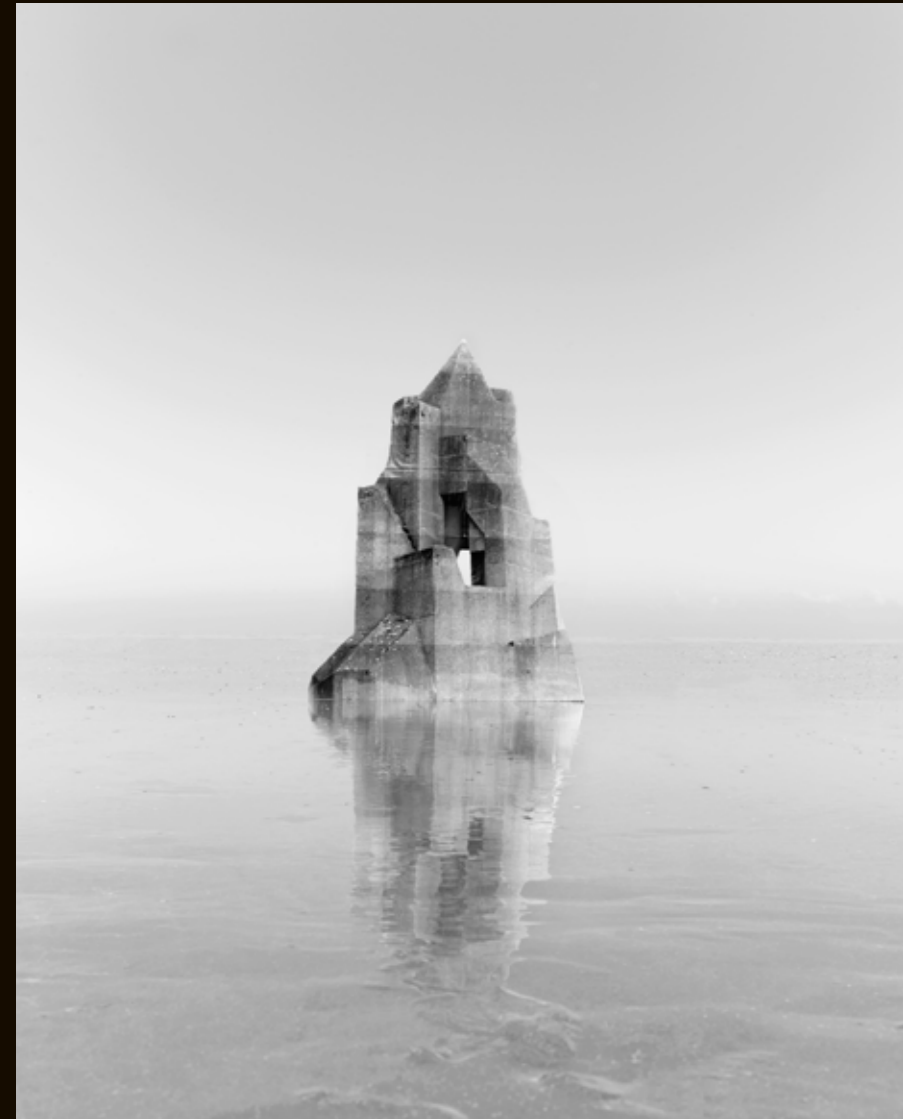
NOÉMIE GOUDAL (1984) Observatoire X, 2014 Galerie Les filles du calvaire, Paris