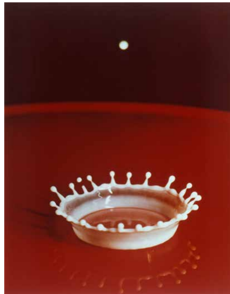
Harold E. Edgerton Milk Drop Coronet, 1957. Dye transfer print. JPMorgan Chase Art Collection © 2015 Estate of Harold Edgerton.