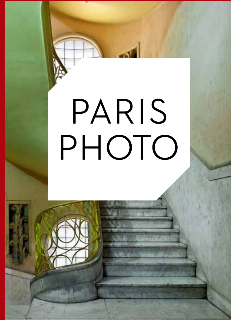
MICHAEL ESTERMAN, BEGOT JAMWELL & BURNAL, 2004. COURTESY EDITH WINKLER GALLERY