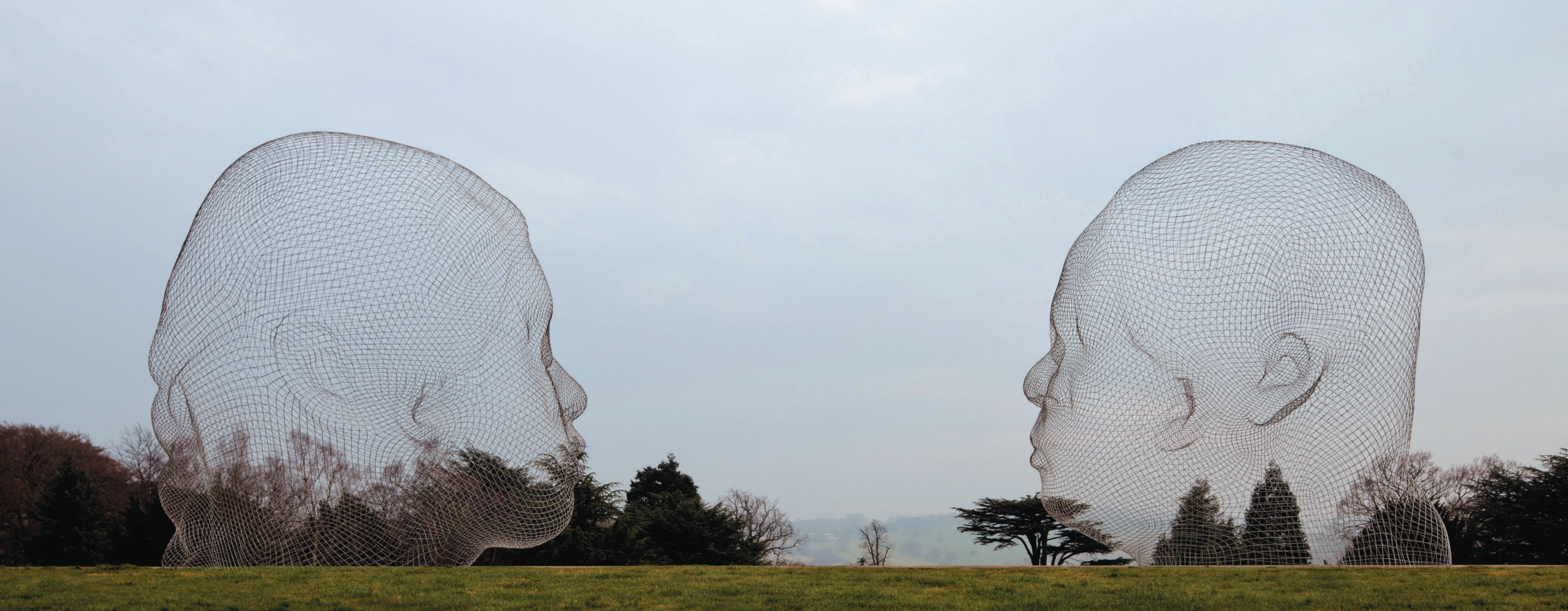
Nuria & Irma, 2011. Nuria: 2007, Acero inoxidable, 400 x 400 x 300 cm. Irma: 2010, Acero inoxidable, 400 x 390 x 290 cm. Vista de la instalación "Jaume Plensa" en el Yorkshire Sculpture Park, West Bretton, Reino Unido.