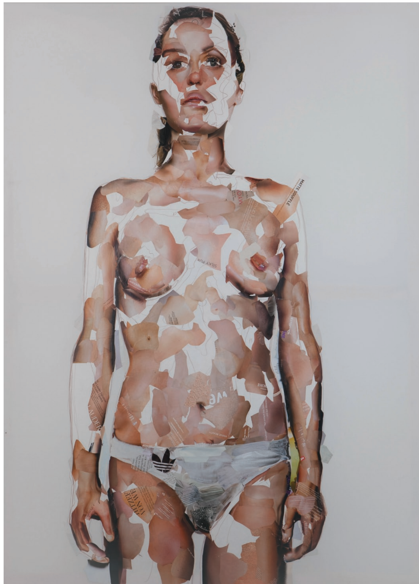
She's Bom With It , 2009, Recortes de revistas sobre tela 165 x 125 cm.