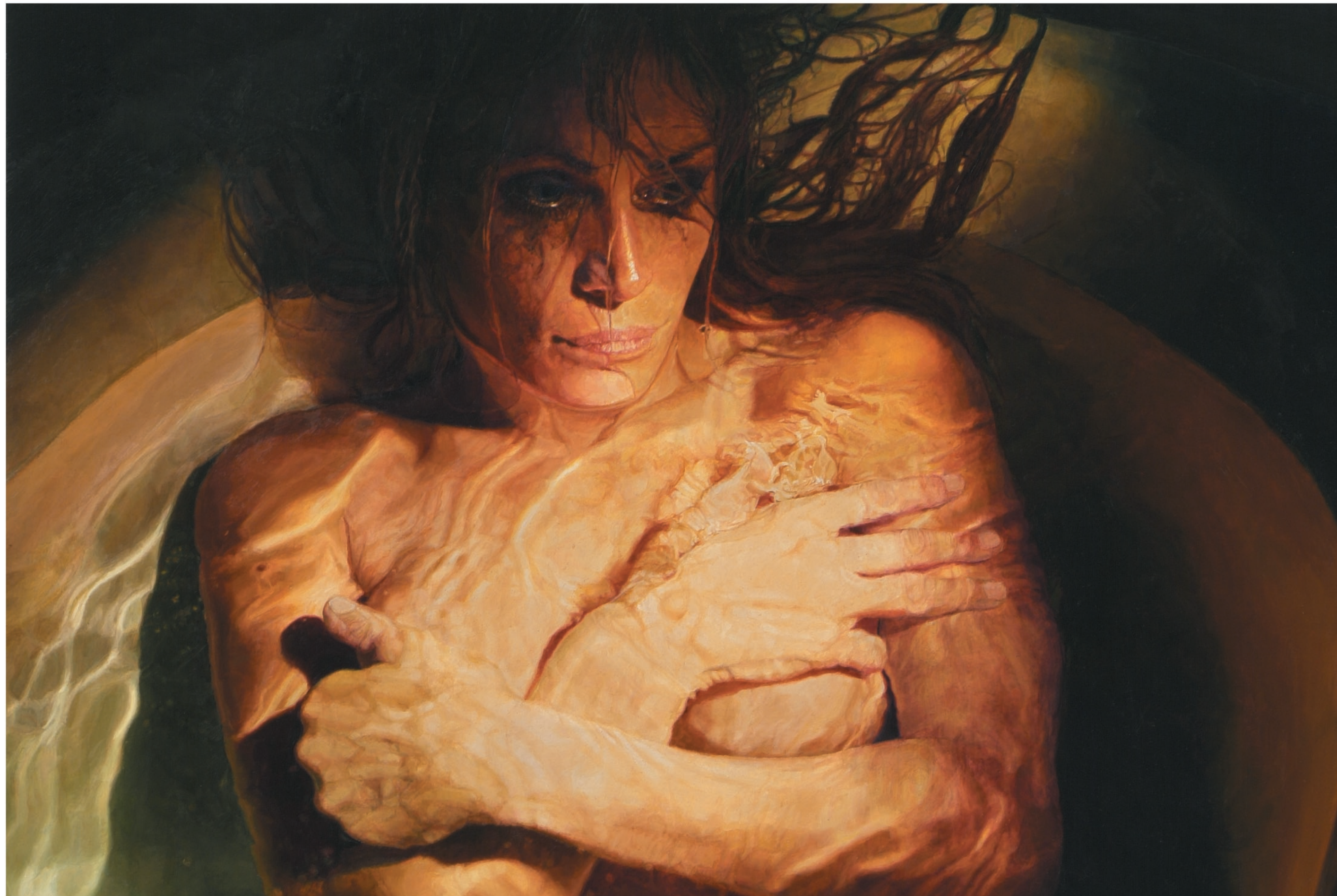
Untitled (Woman with Folded Arms). 2004. Óleo sobre tela y panel, 67.3 x 45.7 cm.