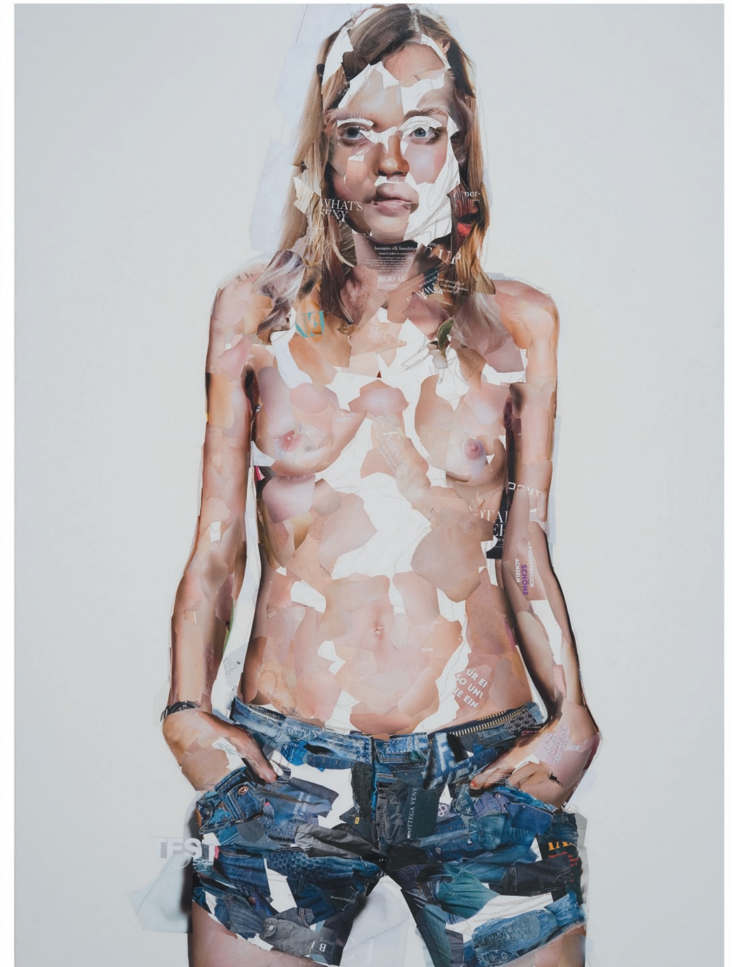
What's Sexy Now , 2009, Recortes de revistas sobre tela. 165 x 130 cm.