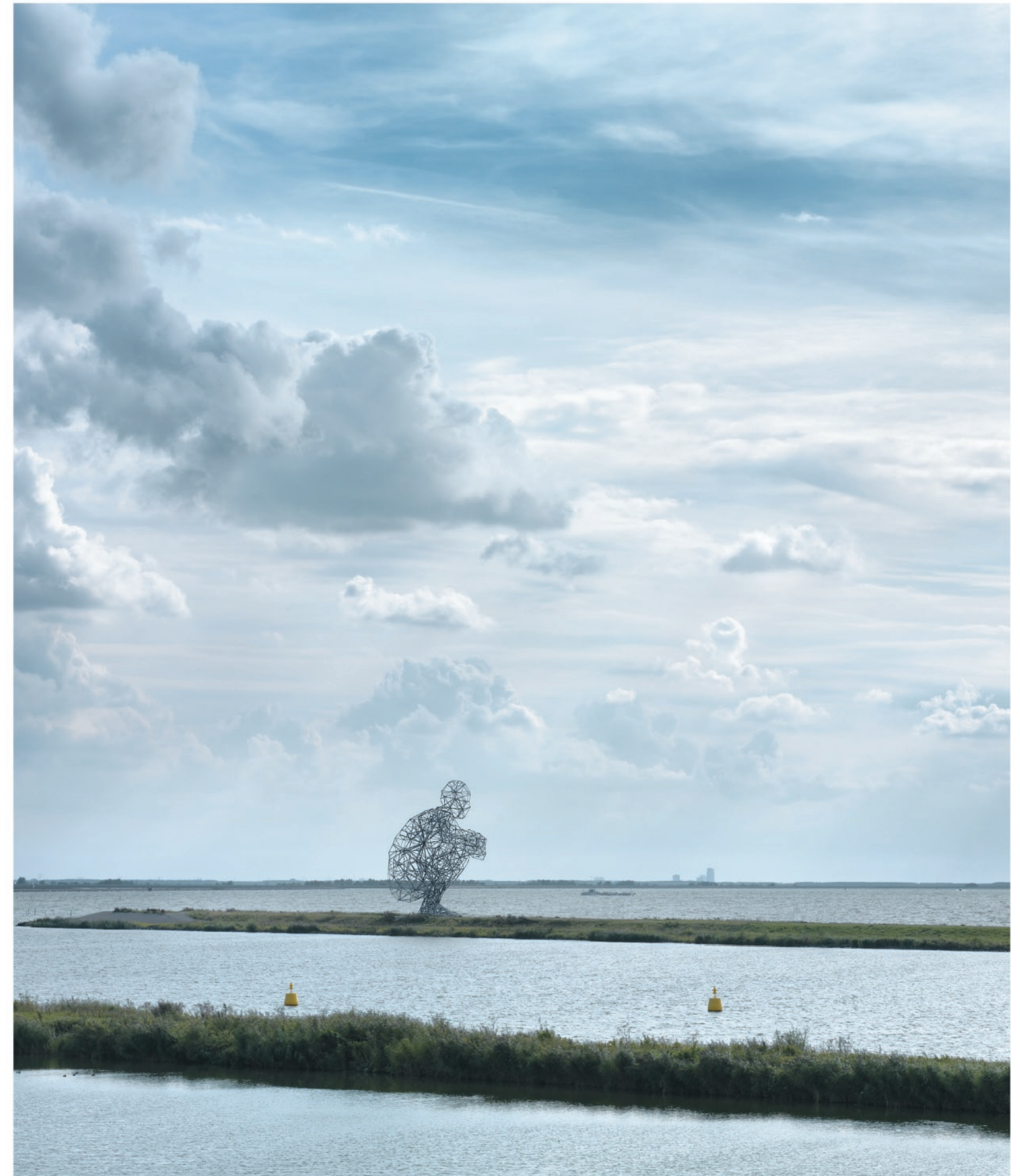
Exposure , 2010, Acero galvanizado, 2.564 x 1.325 x 1.847 cm.