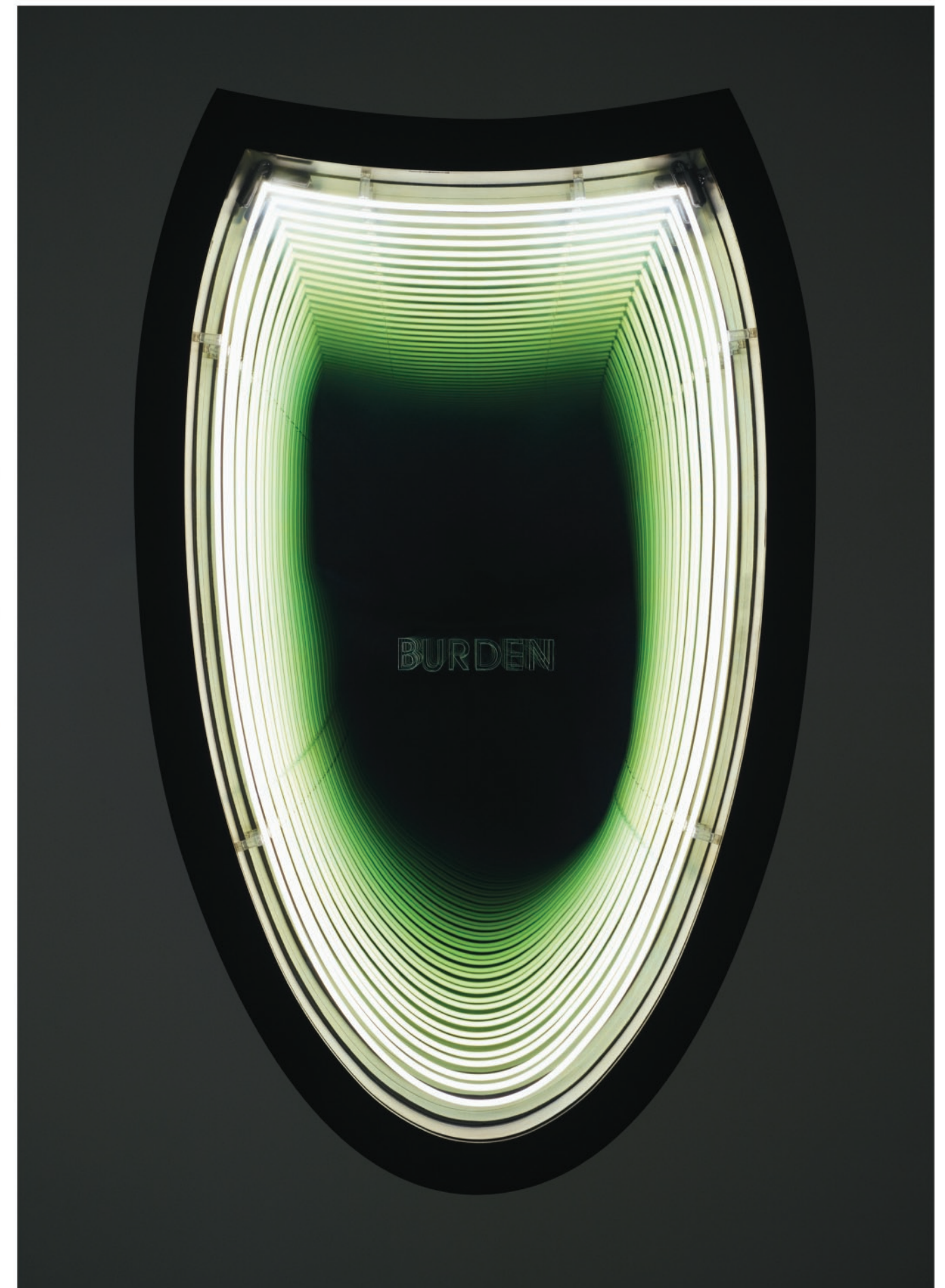
Burden (Lotte World Tower), 2011, Neón, madera, pintura, plexiglass, espejo, espejo unidireccional y energía eléctrica, 172.1 x 106.7 x 16.5 cm.