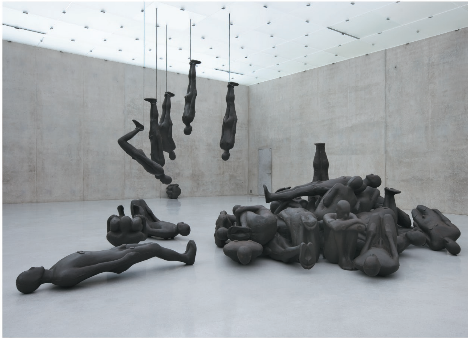
Critical Mass II , 1995, Hierro fundido, Dimensiones variables.