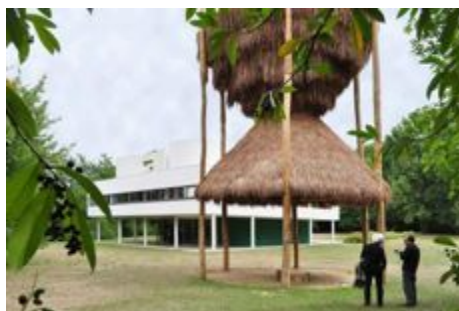
Une hutte/installation de l'artiste Santiago Borja, devant la villa/manifeste de Le Corbusier.

A côté de la toujours moderne Villa Savoye, est érigée, provisoirement, une hutte d'inspiration maya. Le choc des pilotis.