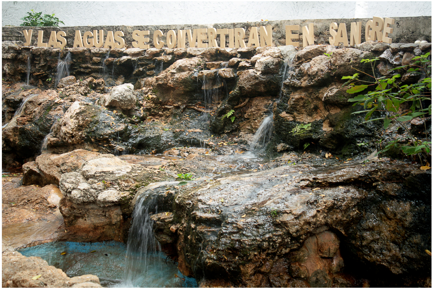
Vanessa Rivero, 2011 "Y las aguas se convertirán en sangre" MDF Intervención en el jardín botánico de la Iglesia de la Ermita de Sta. Isabel, Yuc.