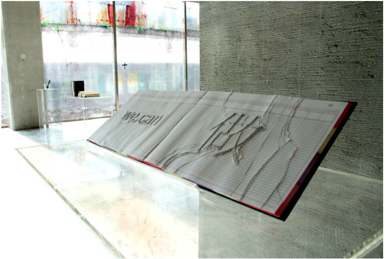
Vanessa Rivero , 2008 "We can do it" Libro de contabilidad, hilo plateado Dentro de Landings 8, Taipei Taipei Fine Arts Museum