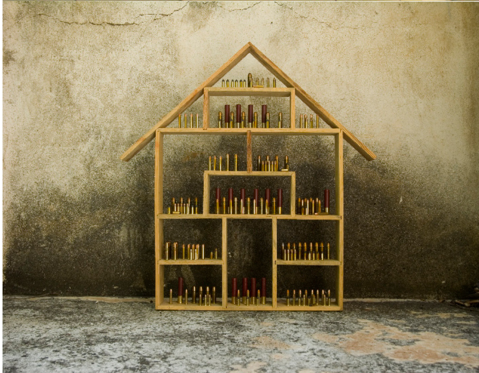
Vanessa Rivero, 2007 "La-memoria" Fotografía impresa/vinil. 2000 x 3000mm

100 Preguntas en relación con los 12, 2007. Proyección/ pared. Medidas variables, 4 min