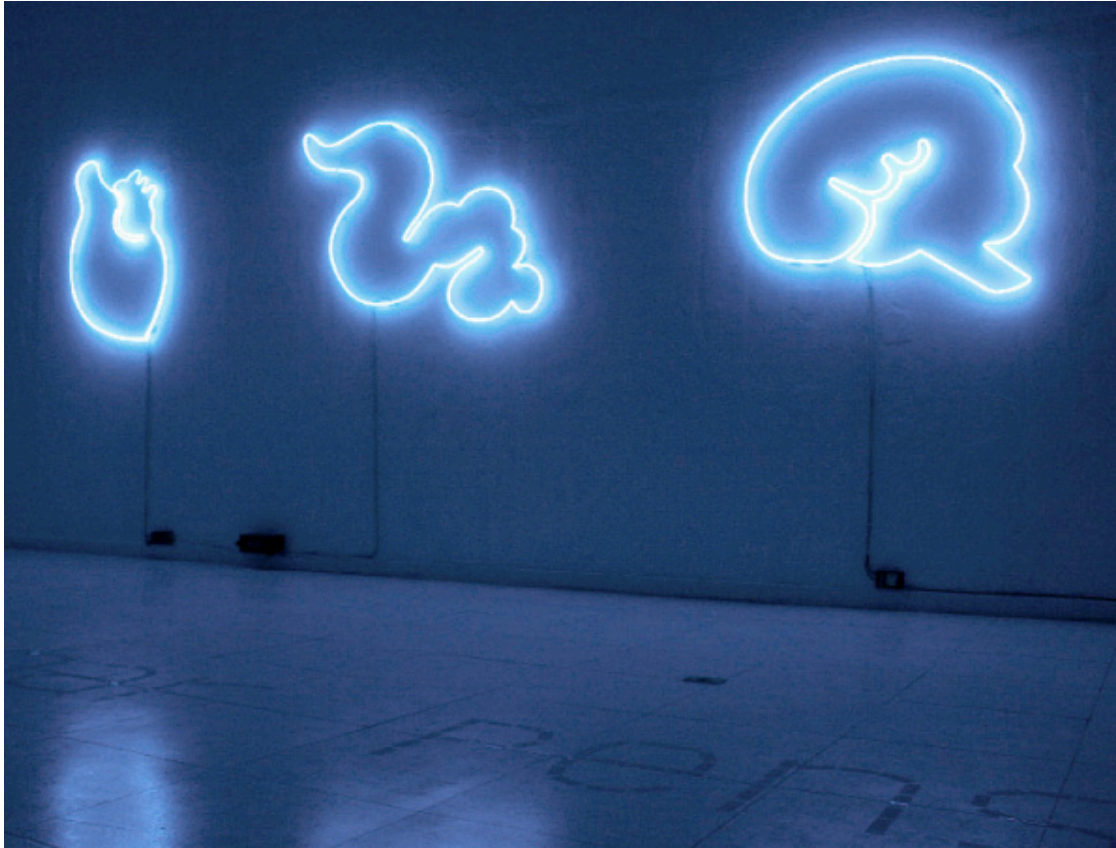
Vanessa Rivero, 2007 "Tres estados corporales (sentir-reaccionar-pensar)" Luz neón Medidas variables (aprox 7 mtrs las tres piezas juntas)