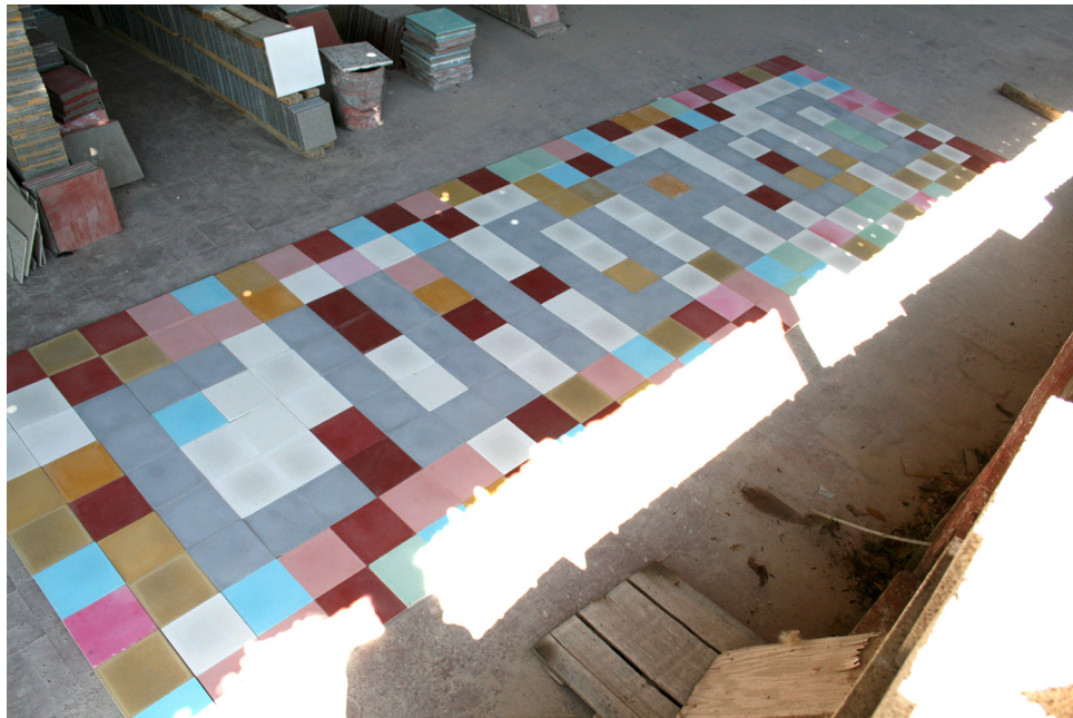
Vanessa Rivero "Cuidado con los traidores", 2009 Mosaicos Proyecto para landings 10- the book