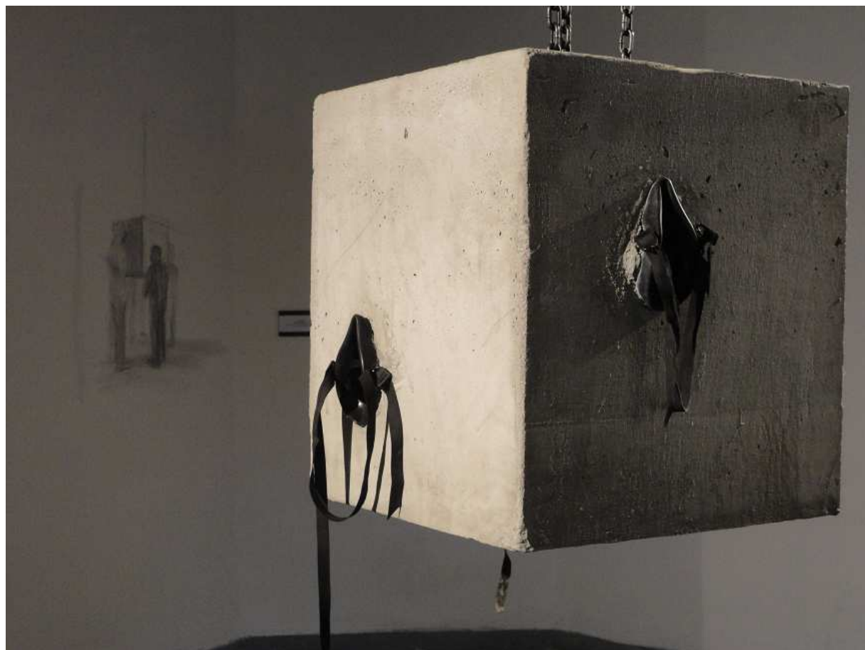
Yoan Capote “Apnea” (dialogusfobia) Concreto, máscaras, documentación fotográfica Dimensiones Variables Pieza única