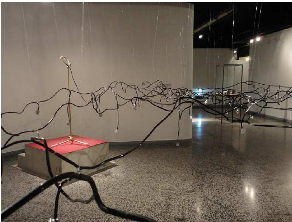
Vista General del Show

Línea 460 / E y F, Vedado, Ciudad Habana, T (537)8327101, F (537)8314646, habana@cubarte.cult.cu www.galerihabana.com