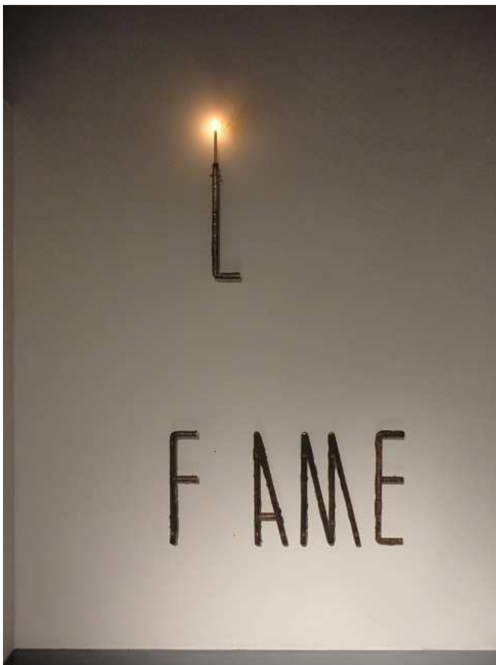
Iván Capote Vanitas, 2010

Bronce y cera, Dimensiones variables Edición de 3