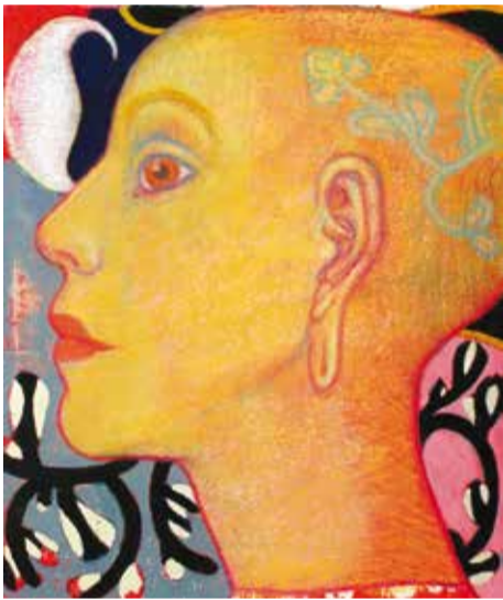
EL TATUAJE 2004 PASTEL, ACRÍLICO Y LÁPIZ SOBRE PAPEL 35 X 25 CM