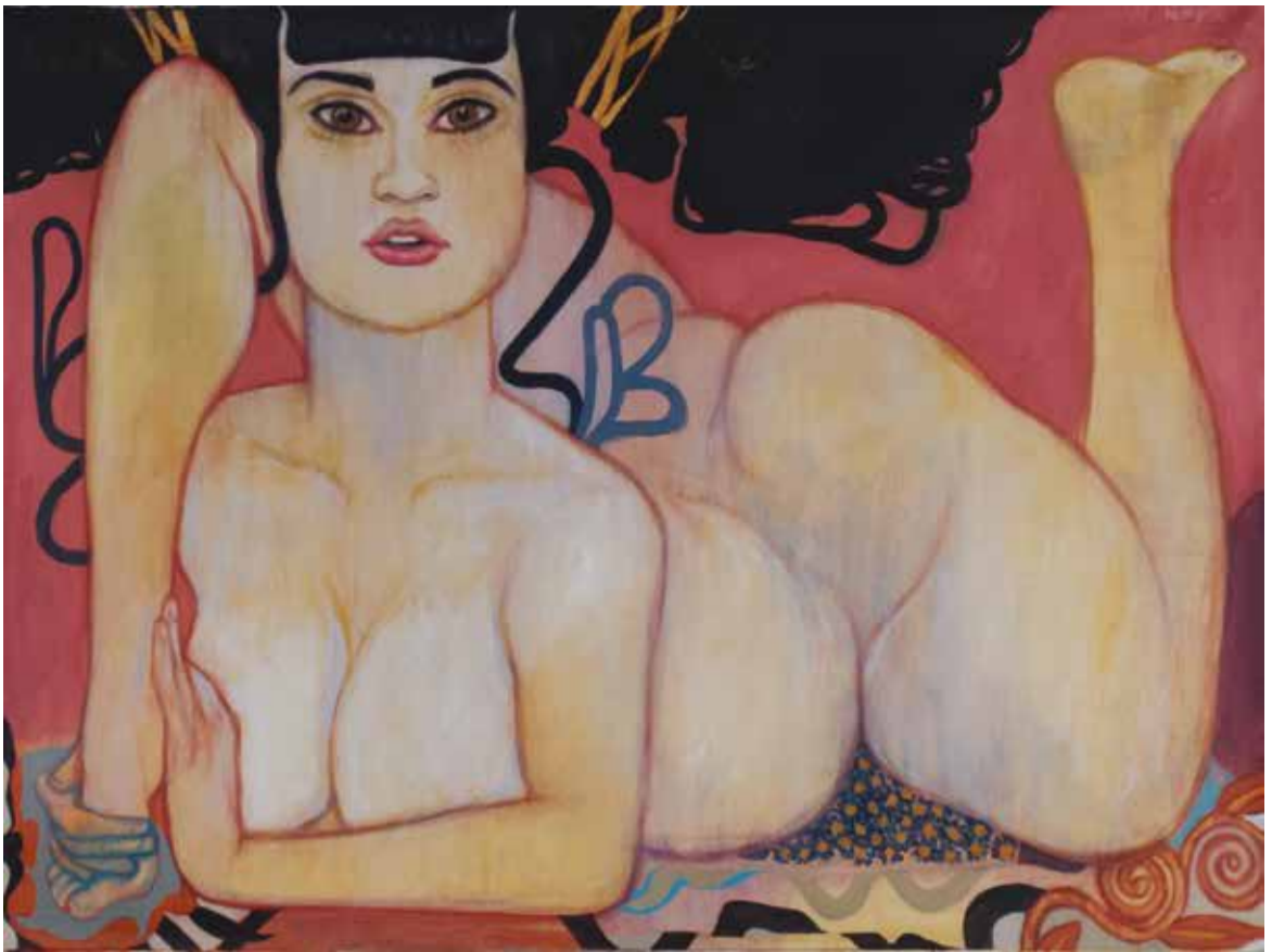
LA ESFINGE / DE LA SERIE LAS CONTORSIONISTAS 2012 ACRÍLICO SOBRE TELA 100 X 130 CM