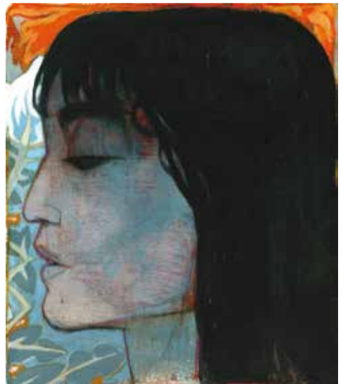
LA MIRADA CERRADA 2009 PASTEL, ACRÍLICO Y LÁPIZ SOBRE PAPEL 35 X 25 CM