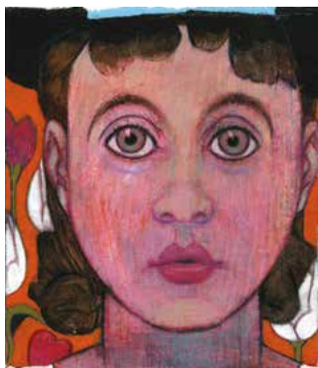
NIÑA MICKEY 2004 PASTEL, ACRÍLICO Y LÁPIZ SOBRE PAPEL 35 X 25 CM