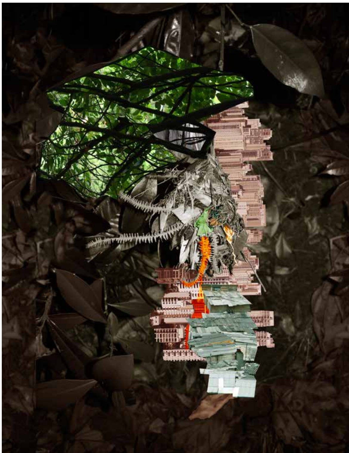
avanhandava , 2015 Jet d'encre sur papier Hahnemühle 55 x 42 cm Edition : 8 + 2 EA