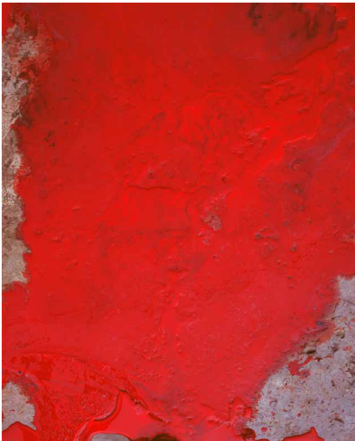
Tupanceretan , 2015 C-print sous Diassec 222 X 180 cm Edition : 5 + 2EA