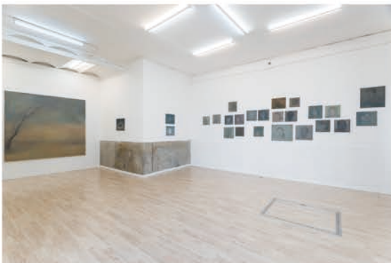
Elvira Poxon: Perecherones, Bones and Other... (2013)