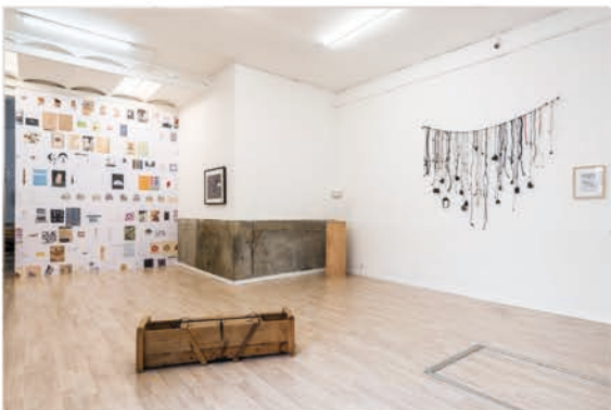
Your Lazy Eye (2015)