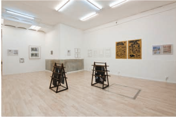
Rests in Press (2012)