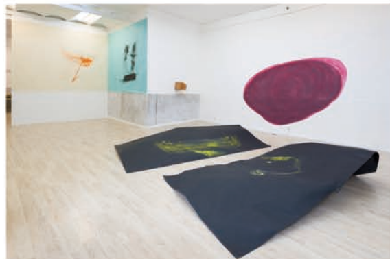
Christian Bagnat: Troika, Hospital, Mamá (2016)