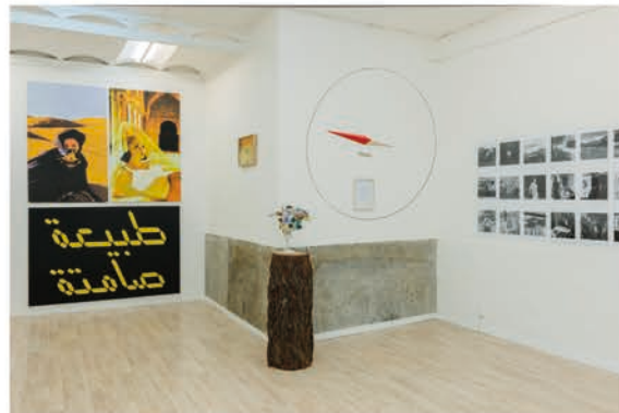
The Call of Destiny (2014)