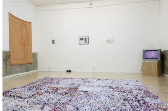
The Fragmented Body (2013)